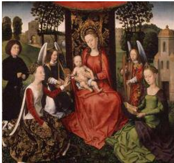
Hans Memling هانس مملنك